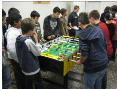
Fussball- und Töggeliturnier während der grossen Pause. Oberstufenschulhaus Kleine Kreuzzelg.

⇒ Triage im Bereich Früherkennung, Prävention und Intervention.