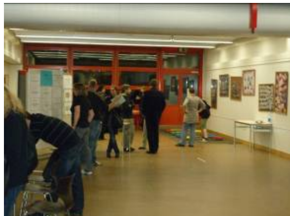
Elternabend Suchtprävention, Oberstufenschulhaus Kleine Kreuzzelg, 2010.