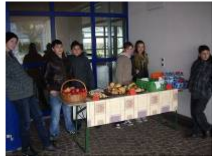
Pausenkiosk während der Projektwoche 2010 Schulhaus Leematten 3, Fislisbach