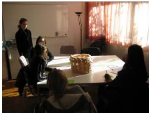
Gruppenberatung, Oberstufenschulhaus Kleine Kreuzzelg.